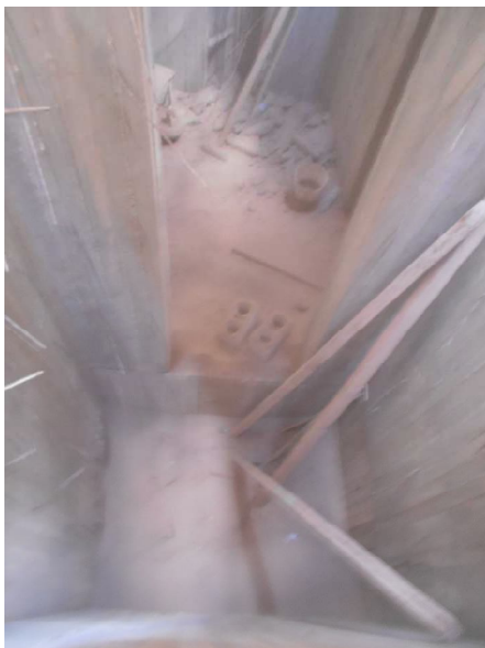
Εικόνα 5: άποψη από το εσωτερικό του φρεατίου για το ασανσερ.