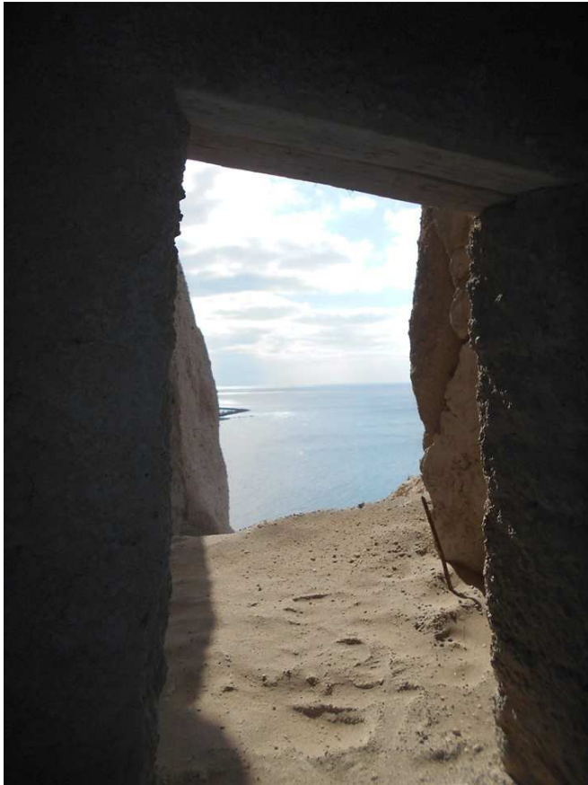
Εικόνα 10: Η απρόσκοπτη θέα που επιθυμούσαν να εξασφαλίσουν πηγώνοντας ηφαιστειακή τέφρα 3000 ετών! Έγκλημα μοναδικής αθλιότητας.