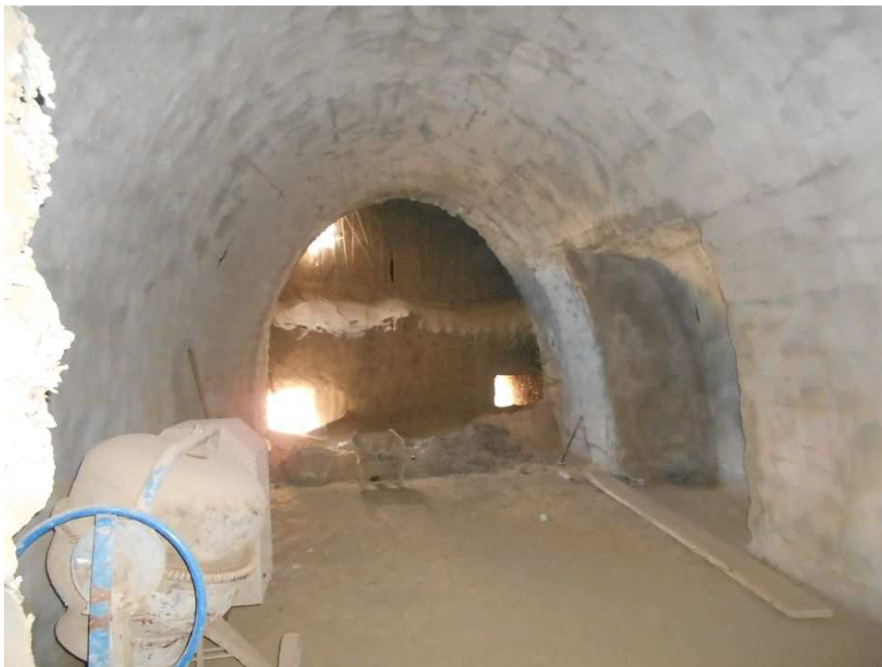
Εικόνα 7: Άλλος ένας υπόσκαφος χώρος που πρόλαβε να τσιμεντοποιηθεί.