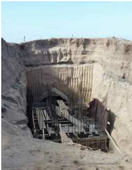
Εικόνα 4: η εξωτερική όψη του ορύγματος, όπου φαίνεται το πρώτο από τα υπόσκαφα.