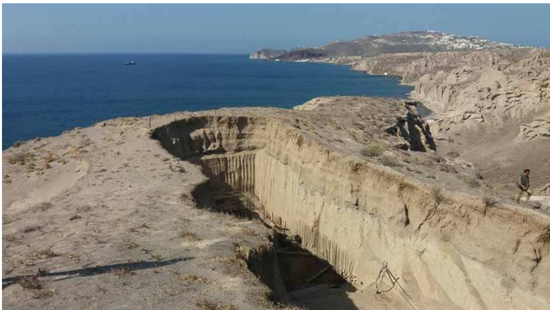
Εικόνα 2: Η είσοδος για το εν λόγω παράνομο υπόσκαφο. Ο αρχαίος οικισμός του Ακρωτηρίου καλύφθηκε με την ίδια ηφαιστειακή στάχτη που έχει διαμορφώσει το μοναδικό τοπίο της Βλυχάδας.