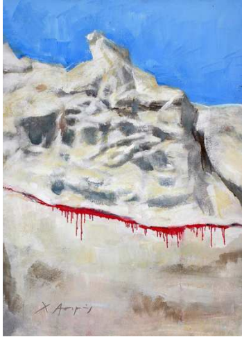
«όχι άλλη μαχαιριά» του εικαστικού Χριστόφορου Ασιμή