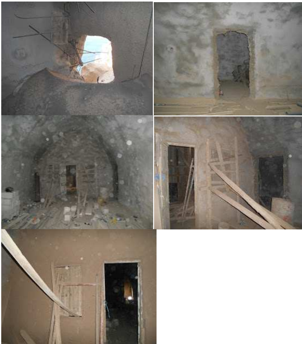
Εικόνα 13: άποψη από τα εσωτερικά δωμάτια που έχουν ήδη κατασκευαστεί.