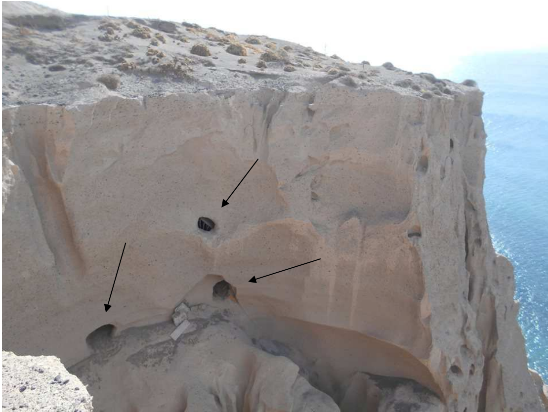
Εικόνα 8: Τρία ανοίγματα στη θηραϊκή γη για να δώσουν φως και θέα στα ενοικιαζόμενα διαμερίσματα. Ο ξενοδόχος φυσικά δε θα τα αφήσει έτσι. Μεγάλες τζαμαρίες θα καταστρέψουν το φυσικό ανάγλυφο. Οι τρεις τρύπες της φωτογραφίας αντιστοιχούν σε αυτές της εικόνας 7.