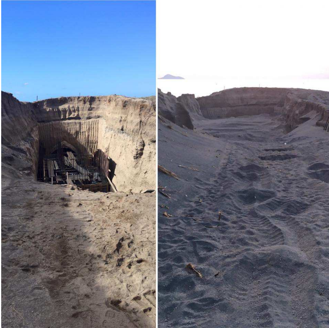
Εικόνα 14: Το πρίν και το μετά. Μπάζωσαν πρόχειρα την είσοδο ώστε να μην είναι δυνατή η αυτοψία από τα αρμόδια όργανα.