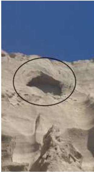
Εικόνα 12: Οι ανεπανόρθωτες βλάβες που επέφερε η οικοδομή στους μοναδικούς σχηματισμούς της Βλυχάδας. Τώρα κρέμονται επικίνδυνα μεγάλοι όγκοι "βράχων" πάνω από την παραλία και τους λουόμενους.