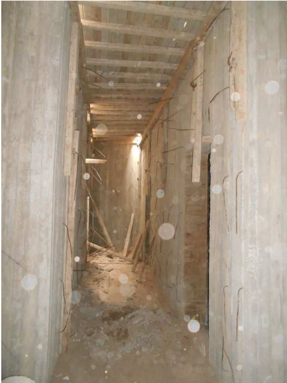
Εικόνα 9: Το φρεάτιο του ασανσερ και οι διάδρομοι.