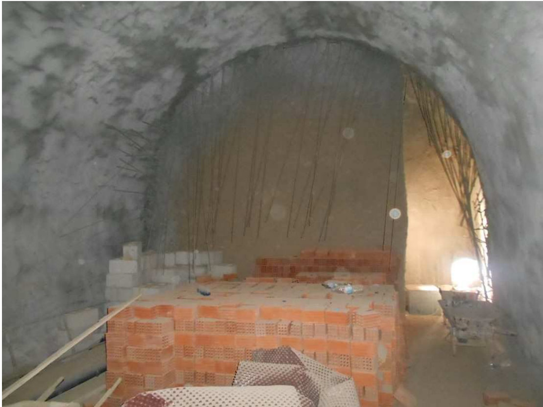
Εικόνα 6: ένας από τους υπόσκαφους χώρους με πρόσβαση στον υπέροχο θηραϊκό ήλιο. Ο τοίχος στο βάθος, που έχει ήδη τρυπήσει τους ευαίσθητους γεωλογικούς σχηματισμούς, θα γκρεμιστεί και θα γίνει ένα τεράστιο παράθυρο.