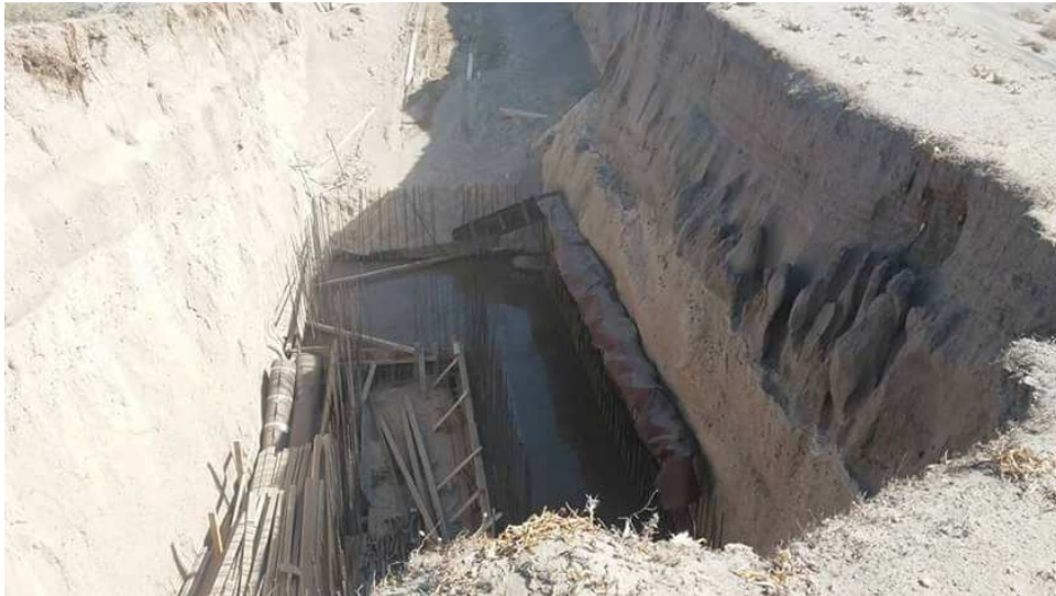
Εικόνα 3: τα μετά ήταν ακόμη υγρά όταν τραβήχτηκαν οι φωτογραφίες