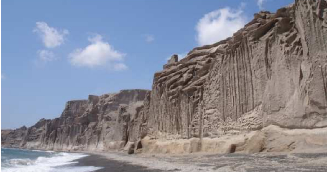
Εικόνα 1: Γενική άποψη της παραλίας της Βλυχάδας.